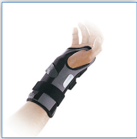
Maatvoering Ligaflex Classic en Ligaflex Manu